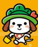
立川市商店街連合会 「トコちゃん」