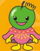
青梅市商店街連合会 「青梅ウメ丸」