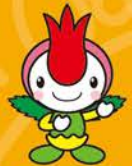
町田市商店街連合会 「サルピアン」